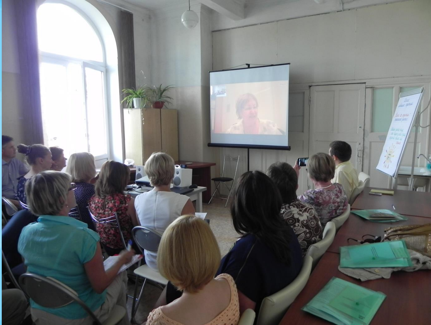
Фото с семинара