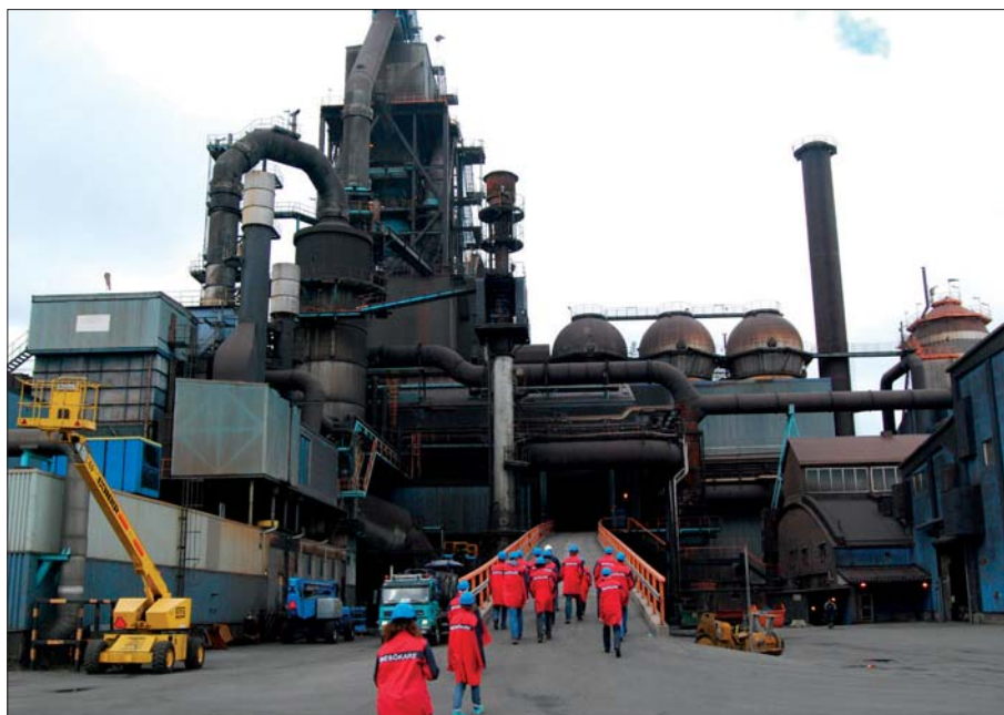
En frivillig utflykt till SSAB anordnades. SSAB arbetar med höghållfast stål och har 8 700 anställda i över 45 länder. Deltagarna fick se delar av produktionskedjan under studiebesöket.