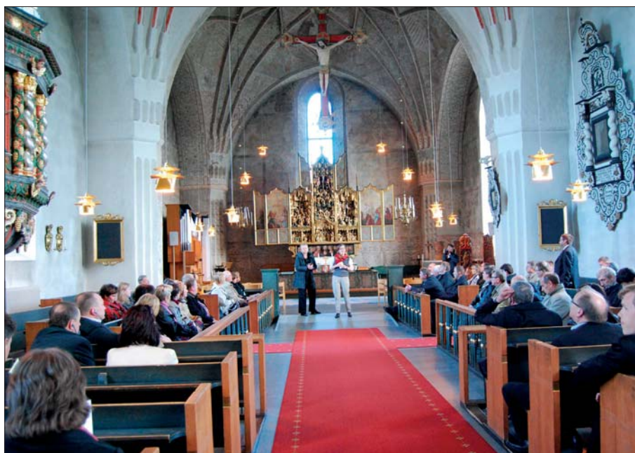
Konferensdeltagarna besökte världsarvet Gammelstads kyrkstad. 1996 upptog UNESCO kyrkstadens på världsarvslistan.