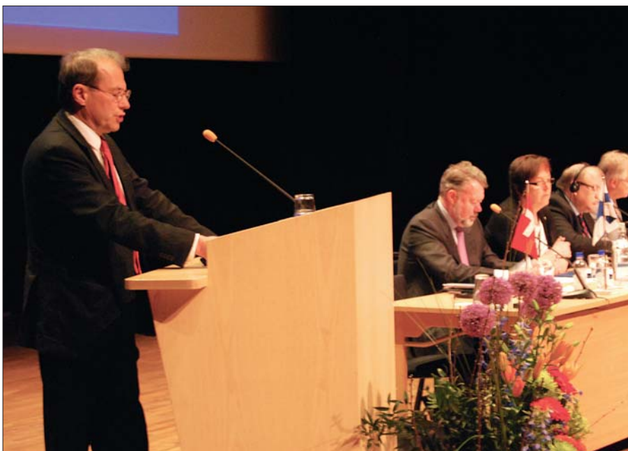
Konferensen öppnades av Sveriges riksdags talman Per Westerberg (till vänster).

Grundvalen för fortsatt tillväxt i regionen är de unika tillgångarna på strategiskt viktiga råmaterial. Ewa Björling nämnde att det svenska ordförandeskapet har tagit flera initiativ för att utveckla transportlösningar och förena regionen med världsmarknaderna. Samtidigt som ekonomisk tillväxt och utveckling är viktigt, kommer hållbarhet att fortsätta att vara en avgörande del av Barentsregionen. För att behålla regionens unika dragningskraft är det viktigt att skydda de bräckliga ekosystemen, lära sig att hantera klimatförändringarna och att använda energi på ett effektivt sätt.