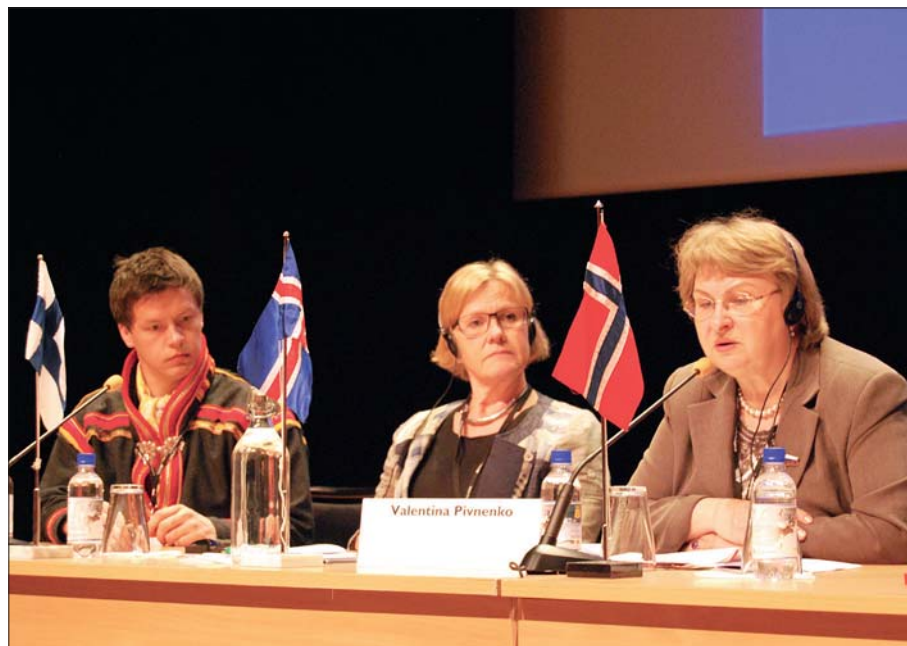
Valentina Pivnenko (till höger), ledamot av ryska statsduman och vice ordförande för den parlamentariska Östersjökonferensen (BSPC).

Valentina Pivnenko nämnde de särskilda ansträngningar som har gjorts av Ryssland, t.ex. beskattning, arbetsrätt, pensionsrättigheter och skydd av urbefolkningar, som har bidragit till utvecklingen i regionen. Dessutom nämnde Valentina Pivnenko att en särskild parlamentarisk kommitté har inrättats i den ryska duman som har förberett 40 lagar avseende norra Ryssland.