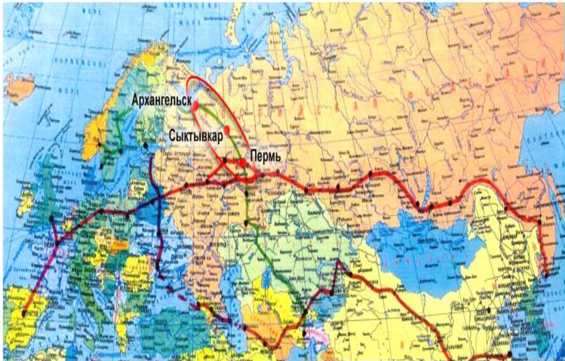
Рис.2. Проект «Белкомур»