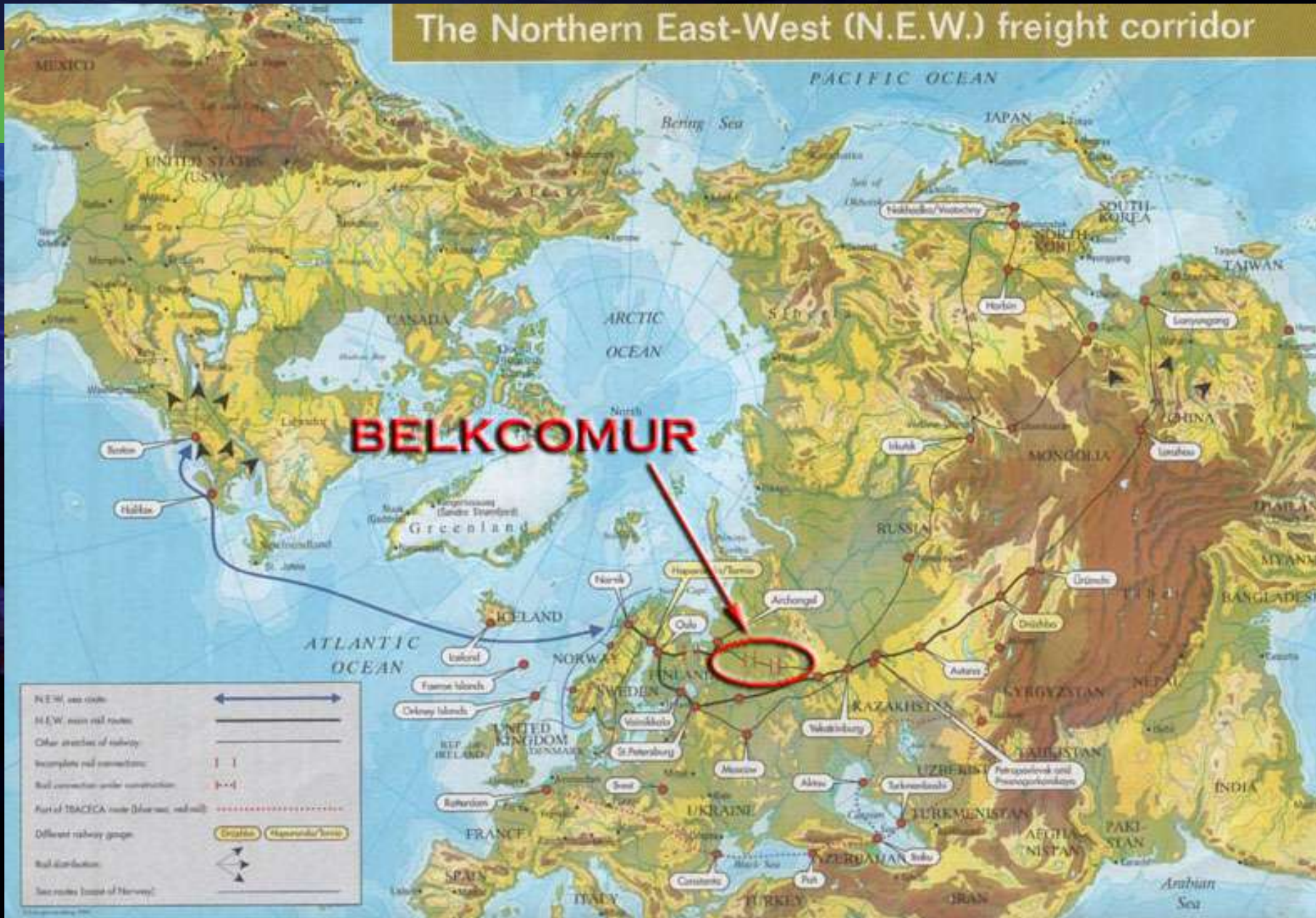
Рис.3. Интеграция проекта «Белкомур» в систему МТК